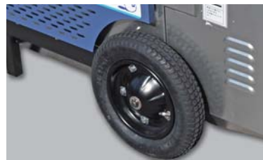
大径車輪で移動が楽

また、「加熱防止サーモスタット」は何らかの原因による異常高温が発生したときバーナーを自動停止させます。